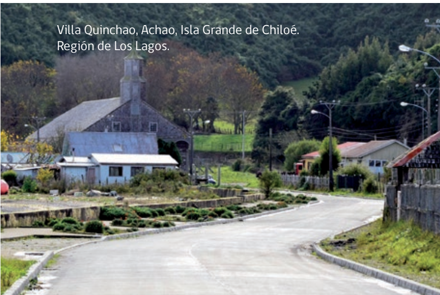
Villa Quinchao, Achao, Isla Grande de Chiloé. Región de Los Lagos.