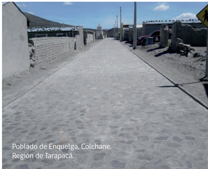
Poblado de Enquelga, Colchane. Región de Tarapacá.