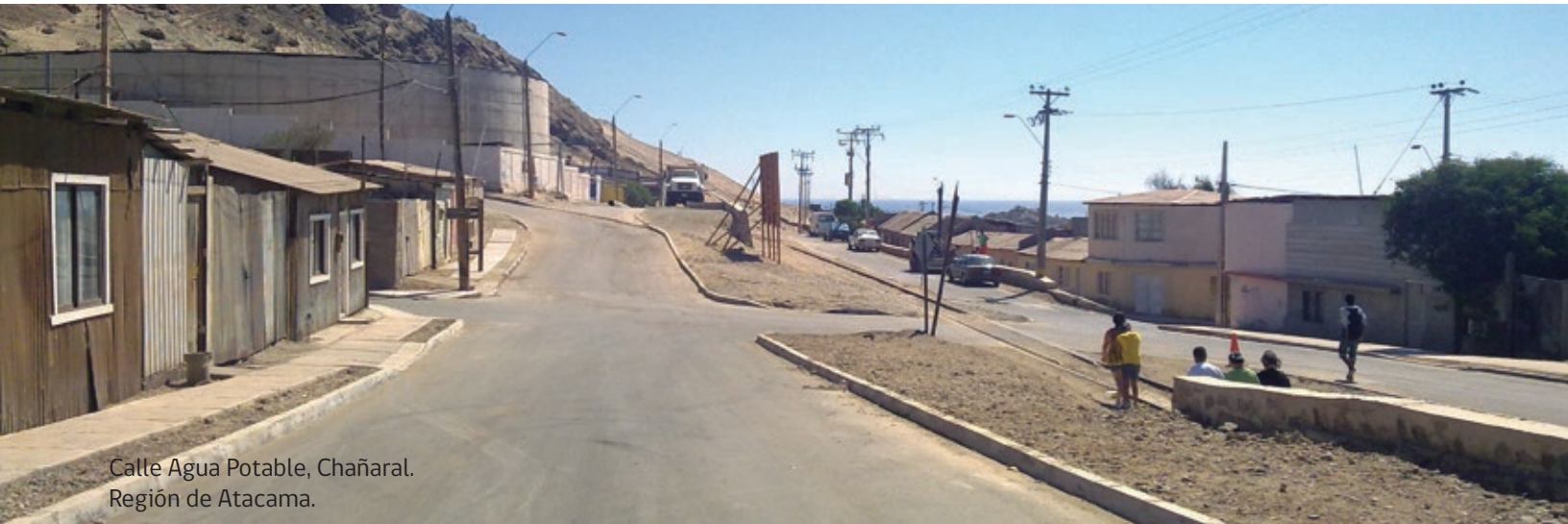
Calle Agua Potable, Chañaral. Región de Atacama.