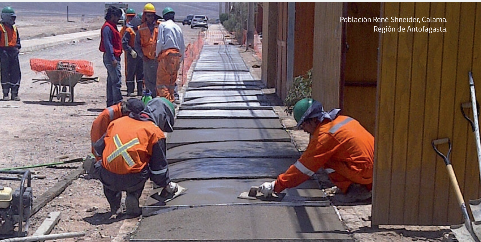
Población René Shneider, Calama. Región de Antofagasta.

Al finalizar las obras, la comunidad participa del acto de recepción y puede disfrutar del resultado de su esfuerzo.